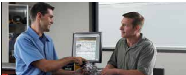
Servicio y soporte local