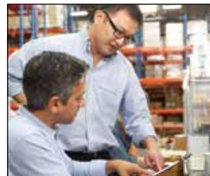
Paquetes de financiamiento habituales