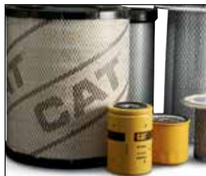
Refacciones genuinas OEM