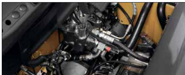
Garantía de fábrica para protección adicional