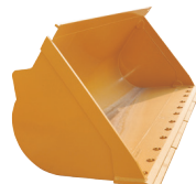
Cucharón para uso general