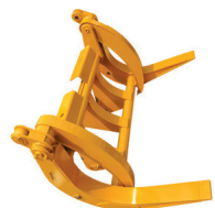
Horquilla QC para tubos