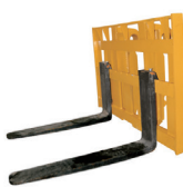
Horquilla para pallet