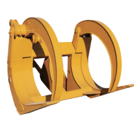
Horquilla para troncos