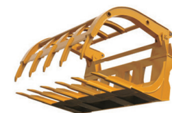
Horquilla QC para heno