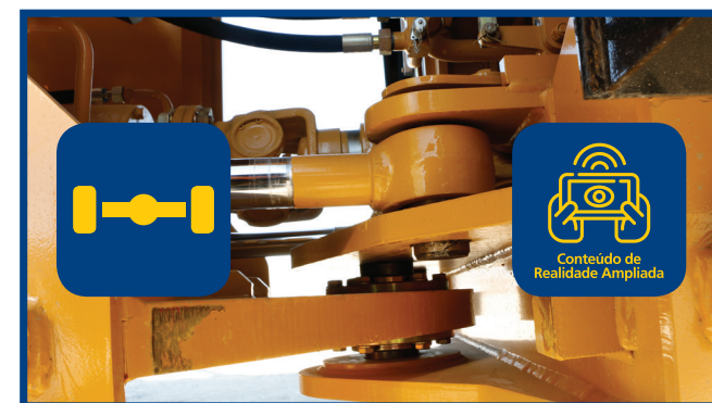
Video 3: Maniobrabilidad