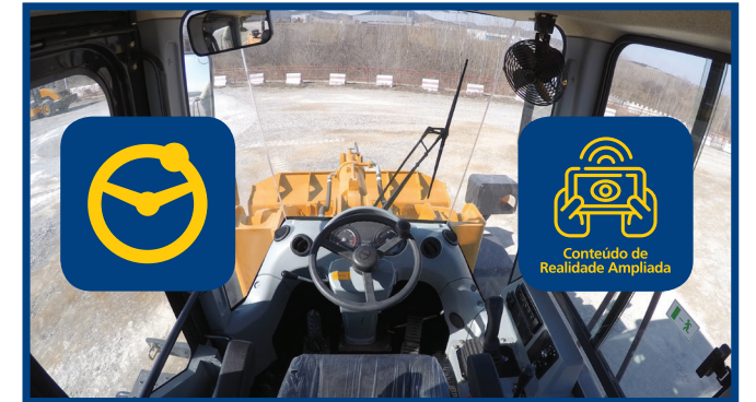
Video 4: Cabina