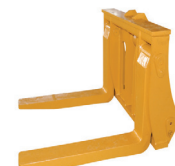
Horquilla para mármol