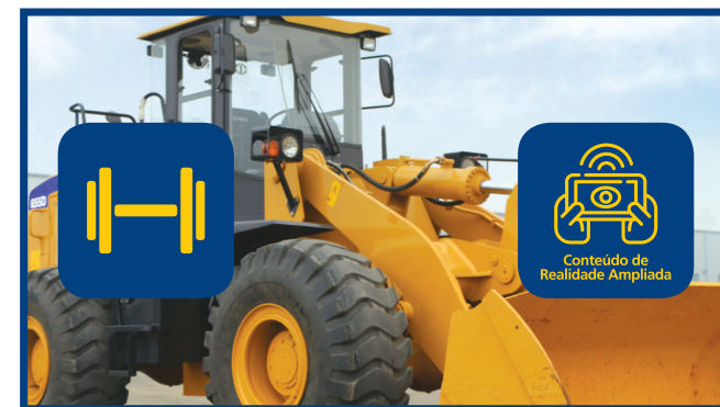
Video 2: Estructura