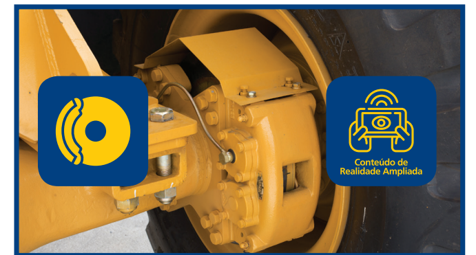
Video 5: Frenos