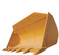
Cucharón QC para rocas

Permite la instalación de accesorios con sistema de enganche rápido (QC)