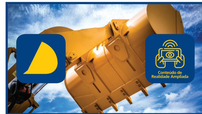
Video 1: Altura de despeje

Para ampliar la información de este catálogo, acceda a Google Play o a App Store con su teléfono móvil, descargue y abra la aplicación MAGIPIX y digite el código de identificación SEM-LATAM, cuando la aplicación lo solicite. Una vez hecho eso, basta con apuntar la cámara hacia una de las imágenes de esta página y disfrutar una experiencia SEM sin igual.