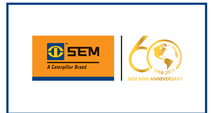
Video 7: Institucional SEM