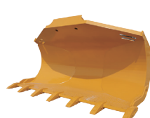
Cucharón de volteo lateral