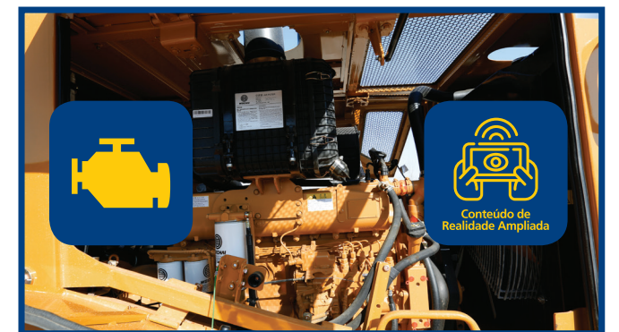
Video 6: Motor