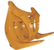
Horquilla QC para troncos