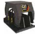
COMPACTADOR DE PLACA