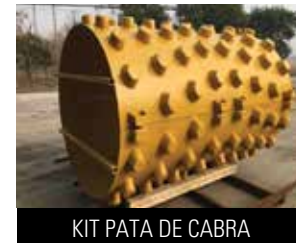
KIT PATA DE CABRA