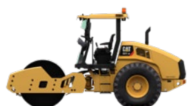
○ CS11 GC

Cat® proporciona opciones para la clase de entre 10 y 12 toneladas métricas a fin de asegurar que la máquina que compra se adapte a la aplicación y las necesidades del negocio.