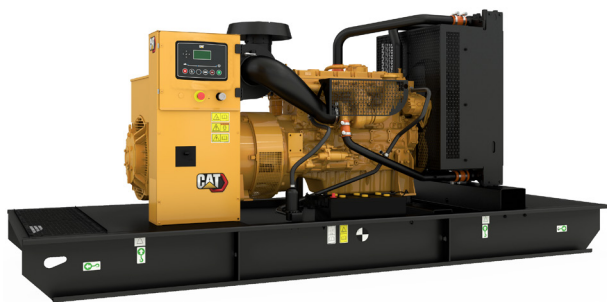
La imagen mostrada podría no reflejar la configuración real