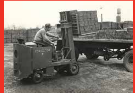
Imágenes históricas de montacargas Towmotor en acción